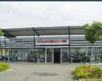
Das Team des Porsche Zentrum Magdeburg belegte beim Händlertest 2011 einen Platz unter den Top Ten. Darauf sind wir stolz.

Porsche Zentren belegen bei Händlertest ersten Platz.