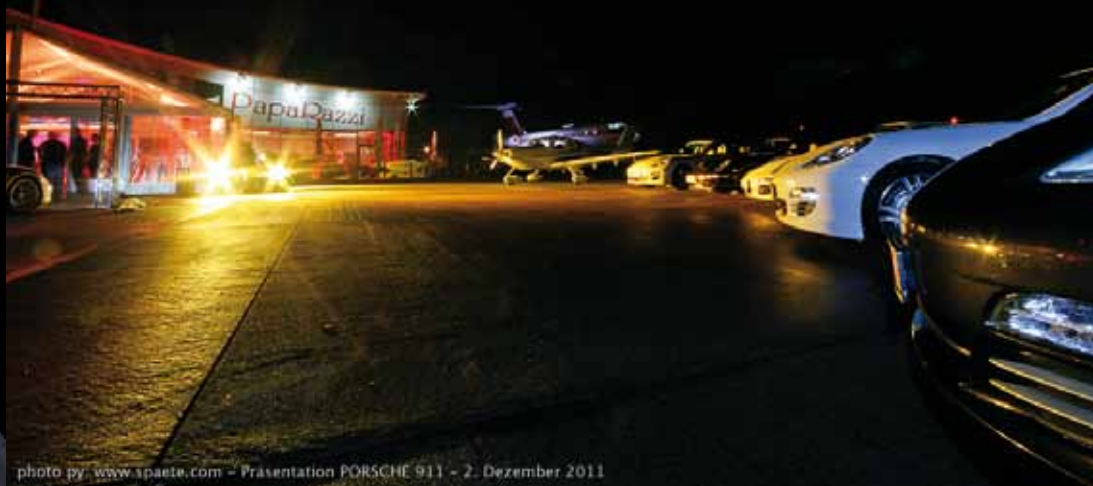
Präsentation PORSCHE 911 - 2. Dezember 2011

Der Flugplatz Magdeburg City liegt im Magdeburger Stadtteil Beyendorfer Grund. Er ist als Verkehrslandeplatz klassifiziert und für Flugzeuge bis 5,7 Tonnen zugelassen. 2010 gab es weder Charter- noch Linienflüge, da die Landebahn für die Jets zu kurz ist. Der Flugplatz wird von Luftsportlern und Privatfliegern sowie für Rundflüge genutzt.