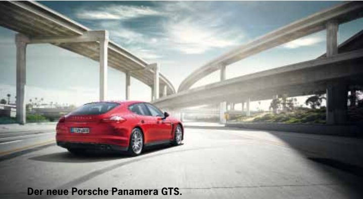
Der neue Porsche Panamera GTS.