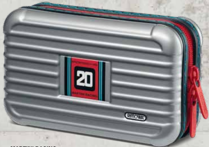
MARTINI RACING WAP 035 303 OD | EUR 85,00*

Und wie es sich für ein Produkt aus dem Hause Porsche gehört, glänzen die PTS Multipurpose Cases nicht nur mit Alltagstauglichkeit, sondern sind auch noch echte Hingucker.