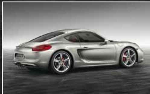
Exterieur-Paket lackiert** und 20-Zoll SportTechno Rad*