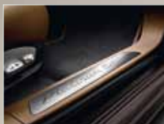
Einstiegsleisten mit Schriftzug „Platinum Edition“.