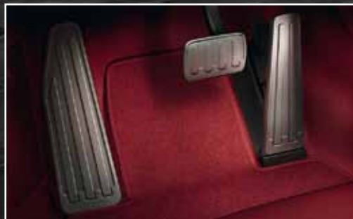
Pedalerie und Fußstütze aus Aluminium*