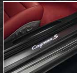
Türeinstiegsblende aus Edelstahl, beleuchtet*