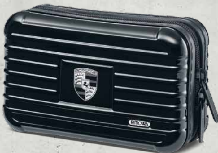
Schwarz WAP 035 302 OD | EUR 75,00*