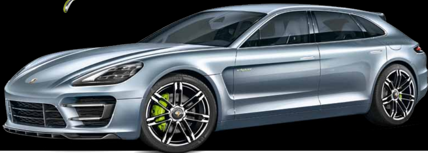
Revolutionär: der Porsche Panamera Sport Turismo.