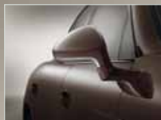
Außenspiegelunterschalen in Platinsilber.

Im Innenraum sorgt die zweifarbige Teillederausstattung in Schwarz und Luxorbeige sowie die Sitzheizung vorne für Komfort. Das SportDesign Lenkrad ist in Verbindung mit PDK oder Tiptronic ein weiteres serienmäßiges Highlight. Und den richtigen Weg schlagen Sie dank des Porsche Communication Managements inkl. Navigationsmodul ein. Am Ziel angekommen ist auf den ebenfalls serienmäßigen ParkAssistenten Verlass. Welches Ziel Sie auch immer ansteuern: Den richtigen Weg haben Sie bereits gewählt. Den Porsche Weg. Er hält noch weitere Individualisierungsmöglichkeiten für Sie bereit. Und lässt dabei keine Wünsche offen. Erleben Sie den Feinschliff – mit der Porsche Panamera Platinum Edition.