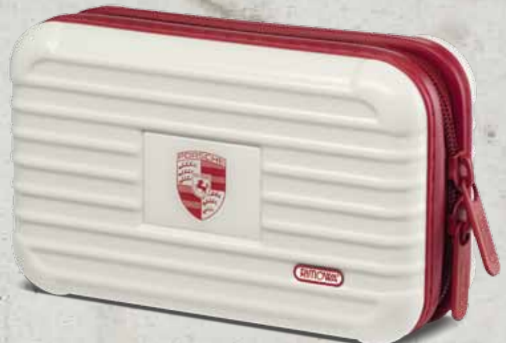
Weiß-Rot WAP 035 301 OD | EUR 75,00*