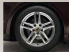
19-Zoll Panamera Turbo Räder mit farbigem Porsche Wappen.

Kraftstoffverbrauch/ Emissionen Porsche Panamera Platinum Modelle (in l/100 km): außerorts 7,8 – 5,6 · innerorts 16,4 – 8,1 · kombiniert 11,3 – 6,3 · CO 2 - Emission in g/km 265/167 · Effizienzklasse C – G