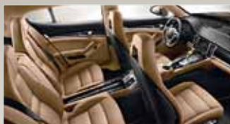
Zweifarbige Teillederausstattung in Schwarz und Luxorbeige.