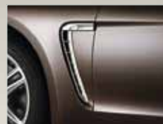
Seitliche Luftauslässe in Platinsilber.