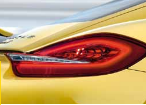
Ausdrucksvolle Heckleuchten in LED-Technik.